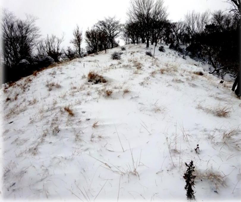
↑エテンの園を見上げる