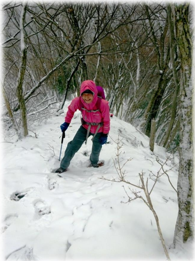
↑下部落葉樹林帯を登る