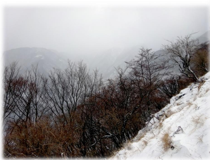
↑エテンの園から塔ノ岳方面