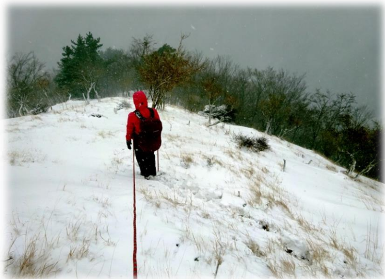
↑エテンの園を降る ↓6日前の同じ場所