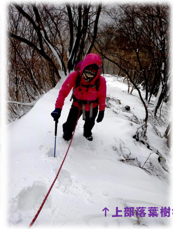
↑上部落葉樹林帯を登る