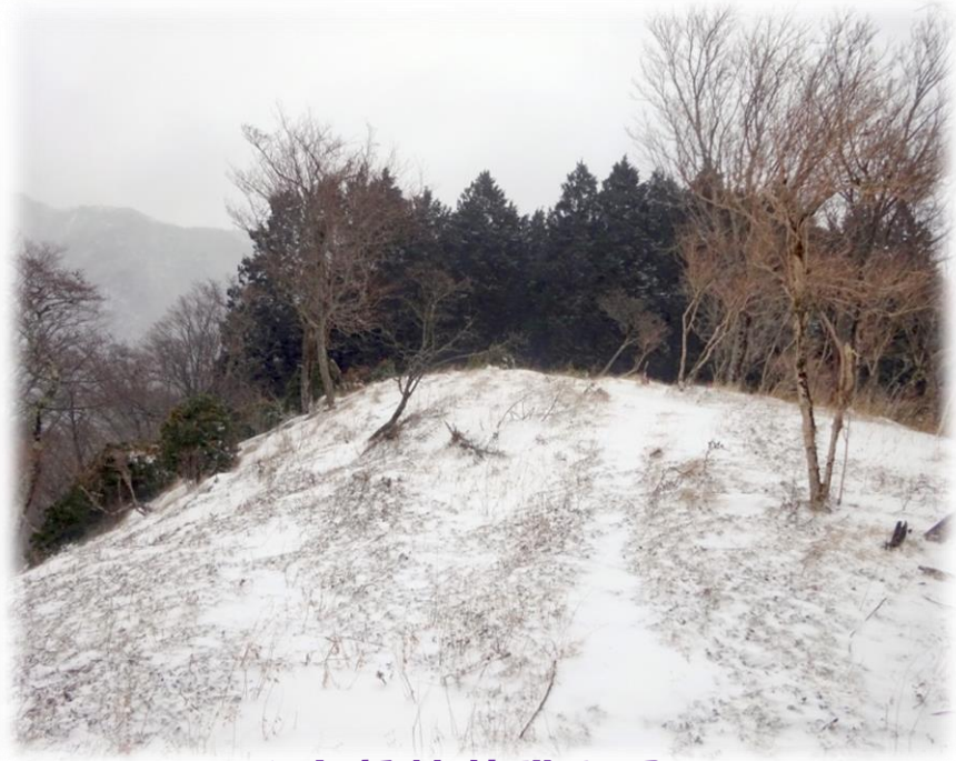
↑上部植林帯入口 ↓帰りの戸川林道